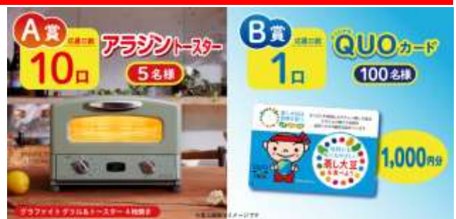
キャンペーン賞品