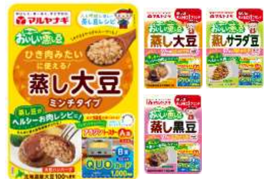
キャンペーン対象商品（全4品）

厳正な抽選のうえ、当選者を確定します。当選発表は、当選者へのみマルヤナギLINE公式アカウントから当選のご案内を差し上げます。