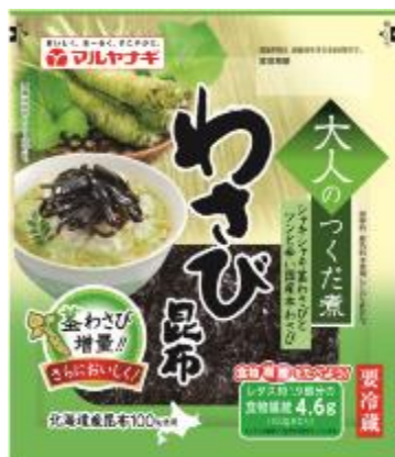
大人のつくだ煮 わさび昆布 内容量 100g 賞味期間 要冷 45日 希望小売価格 215円（税抜）