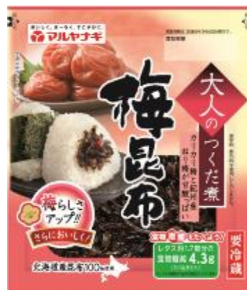
大人のつくだ煮 梅昆布 内容量 100g 賞味期間 要冷 60日 希望小売価格 215円（税抜）