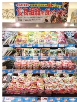
※関西地区Aスーパー（画像のご利用はご相談ください。）

食物繊維摂取推進による日本人の健康課題解決応援の主旨にご賛同いただいたスーパーにご協力をいただき、食物繊維をたべようメッセージの売り場作りも推進しています。