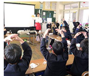
【ご参考】2018年2月の食育授業の様子