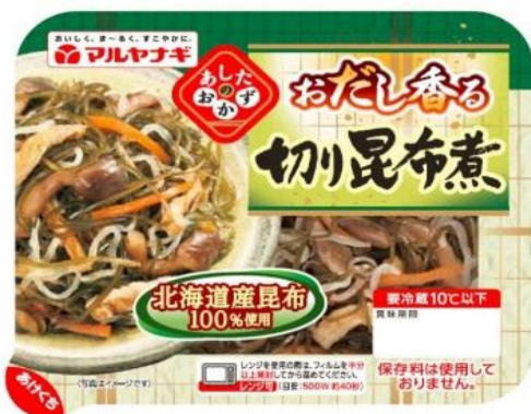
あしたのおかず おだし香る切り昆布煮 内容量：90g 希望小売価格：税抜208円 JANコード：4901148 083824