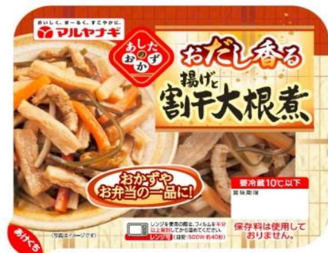
あしたのおかず おだし香る揚げと割干大根煮 内容量：100g 希望小売価格：税抜208円 JANコード：4901148 083817