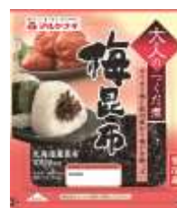
大人のつくだ煮 梅昆布 内容量：100g 希望小売価格：税込232円 サイズ：185×160×10 賞味期間：要冷60日 JANコード：4901148023578