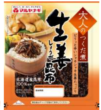
大人のつくだ煮 生姜昆布 内容量：100g 希望小売価格：税込232円 サイズ：185×160×10 賞味期間：60日 JANコード：4901148023202