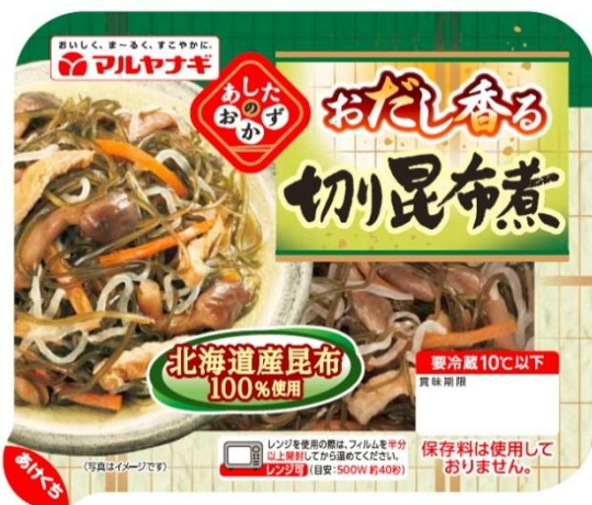
あしたのおかず おだし香る切り昆布煮 内容量：90g 希望小売価格：税抜208円 JANコード：4901148 083824 食塩相当量 1.5g/100g