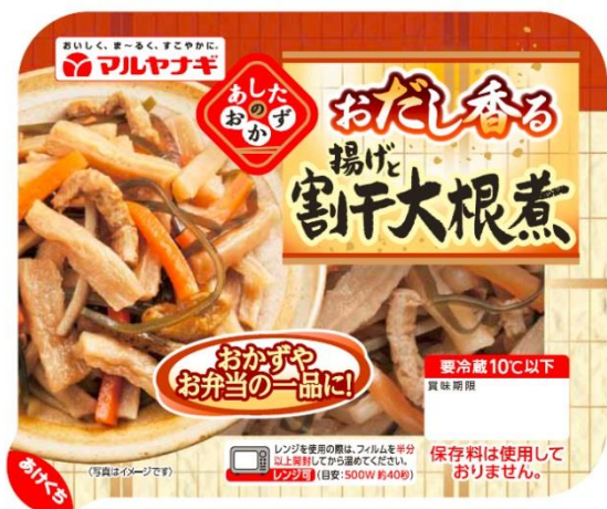
あしたのおかず おだし香る揚げと割干大根煮 内容量：100g 希望小売価格：税抜208円 JANコード：4901148 083817 食塩相当量 1.4g/100g