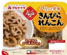
きんぴられんこん