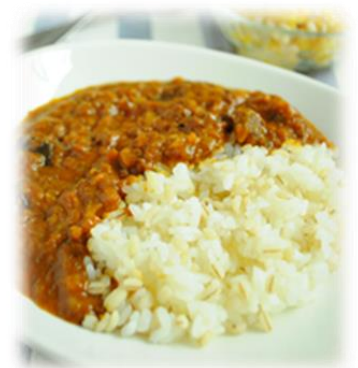
調理例；もち麦入りカレーライス

内容量：70g 希望小売価格：税込142円 サイズ：180×130×20 賞味期間：60日 JANコード：4901148076475