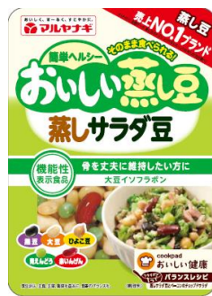
③おいしい蒸し豆 蒸しサラダ豆