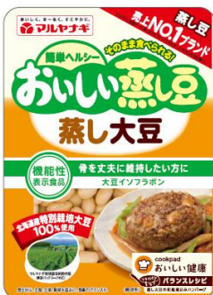
①おいしい蒸し豆 蒸し大豆