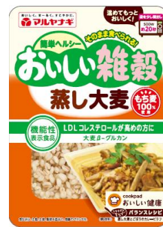
④おいしい雑穀 蒸し大麦