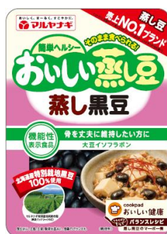
②おいしい蒸し豆 蒸し黒豆