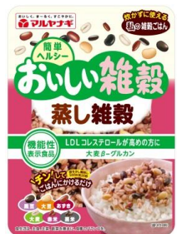
⑤おいしい雑穀 蒸し雑穀